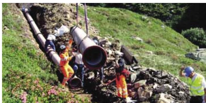
Montáž v horském terénu