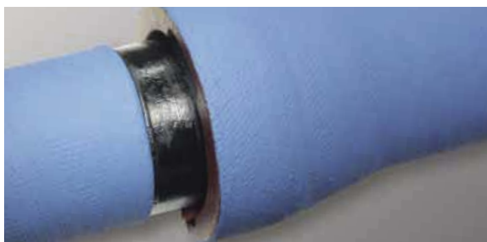
Trouba OCM se spojem BLS®